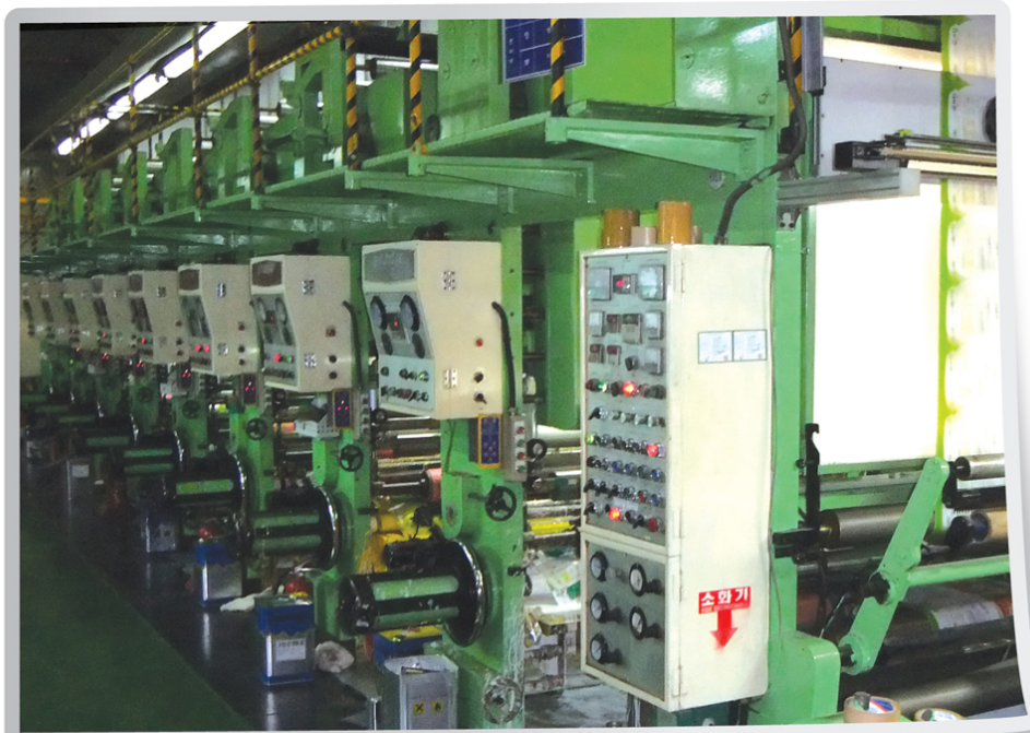
그라비아인쇄8도기 / 8-degree gravure printing machine