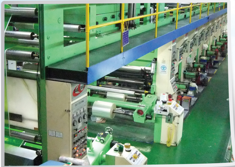
그라비아인쇄9도기 / 9-degree gravure printing machine

Desire for the best quality - Manufacturing line with the latest technology