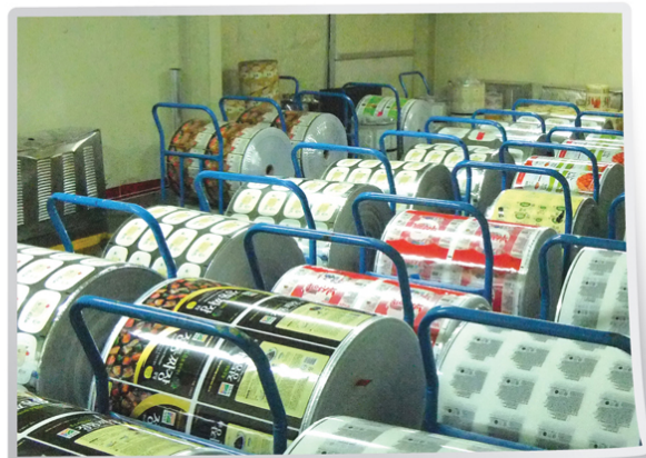
숙성실 / Aging room