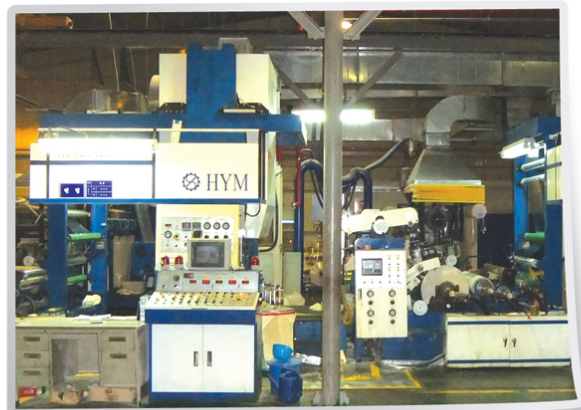
압출라미네이팅기(텐덤) / Extrusion laminator