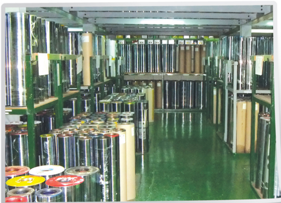
동판실 / Copperplate room